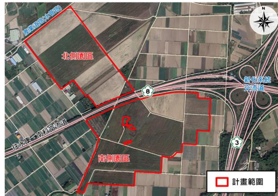
新市產業園區位置圖